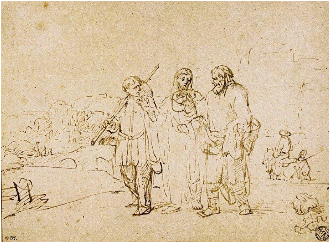
De Emmaüsgangers - Rembrandt van Rijn (1606 - 1669)